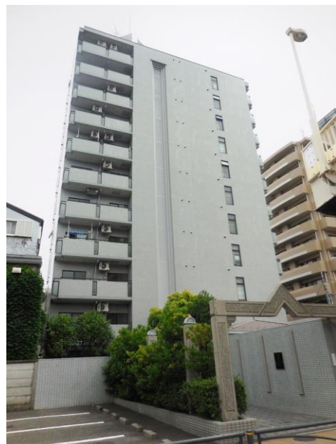
【現地外観】令和2年5月撮影