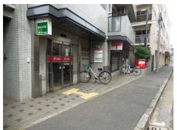
横浜生麦郵便局(約50m)