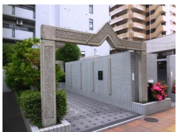
【現地 エントランス】