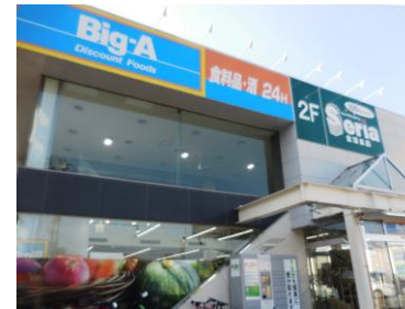
Big-A・セリア 約230m 徒歩3分