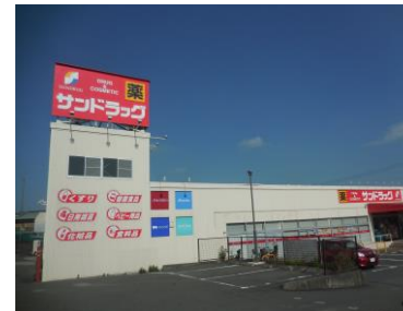
サンドラック 約250m 徒歩4分