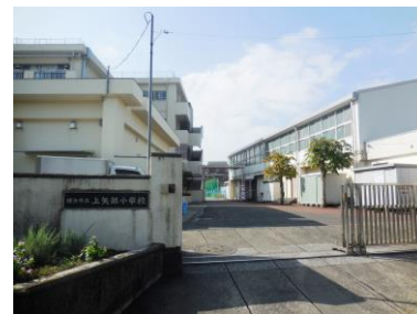
上矢部小学校 約300m 徒歩4分