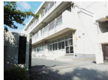
岡津中学校 約900m 徒歩12分